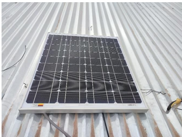
Pegado de panel solar a la calamina con Sikaflex