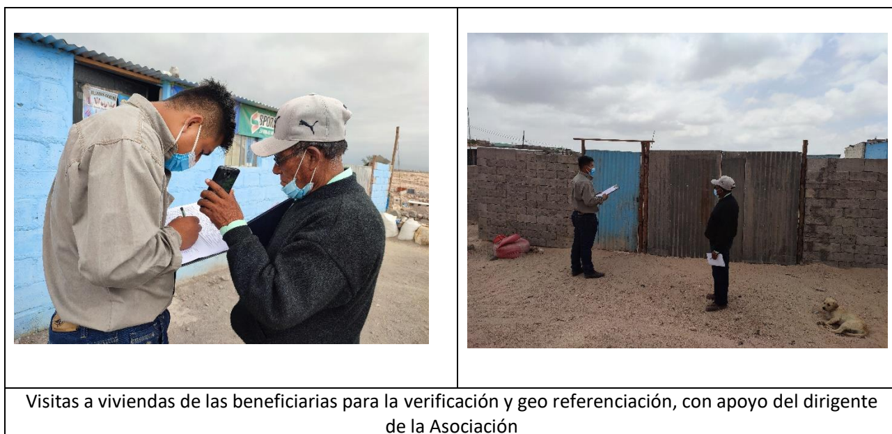
Visitas a viviendas de las beneficiarias para la verificación y geo referenciación, con apoyo del dirigente de la Asociación

Posteriormente, el equipo técnico, procedió a realizar visitas de verificación y geo referenciación a las viviendas con apoyo del dirigente de la Asociación, para la elaboración de un mapa que permita gestionar eficientemente los recursos.