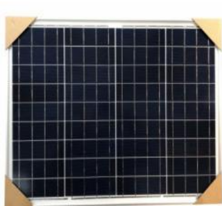
Panel solar de 50 watts