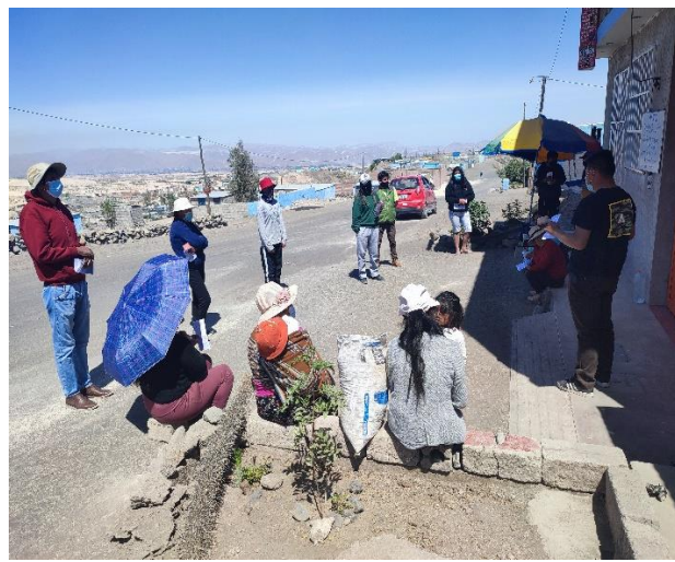
Capacitación general a beneficiarios del proyecto