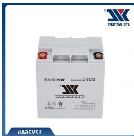
Batería 26 Amper hora