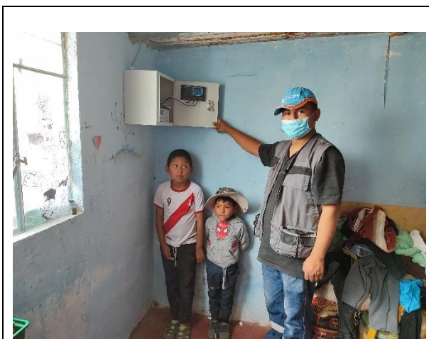
Instalación de kit de energía solar en la Mz. L - Lt. 3