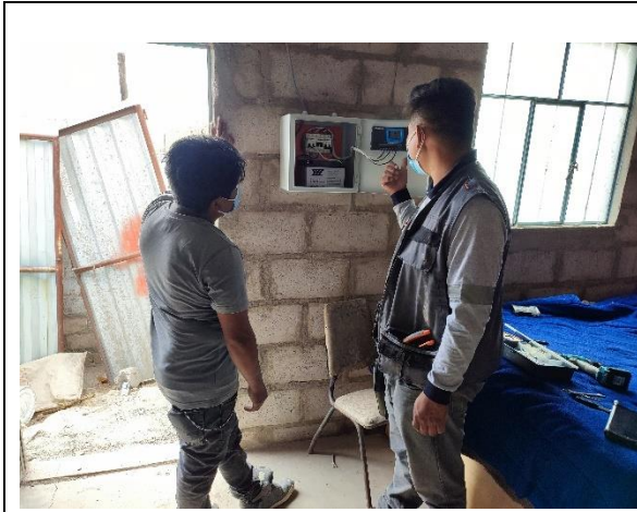
Capacitación en el uso y funcionamiento de los equipos instalados