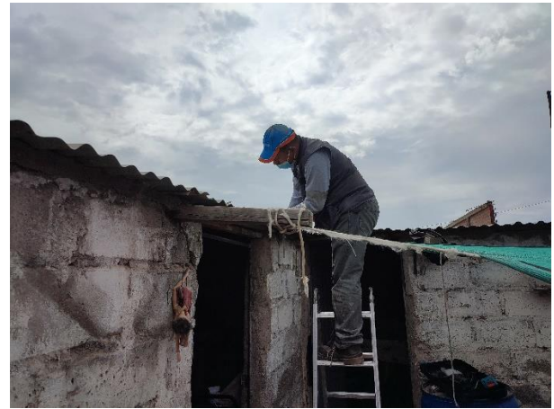
Colocación del panel solar en los techos de calamina