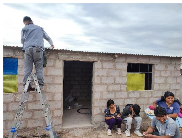
Colocación del panel solar en la Mz. I - Lt. 7