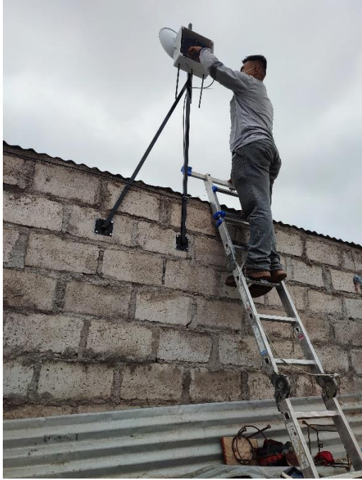
Instalación de antenas de internet en la Mz. N Lt. 11