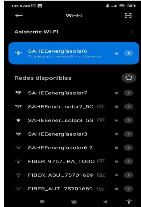
Captura de pantalla de celular de beneficiaria conectada al Wifi del proyecto