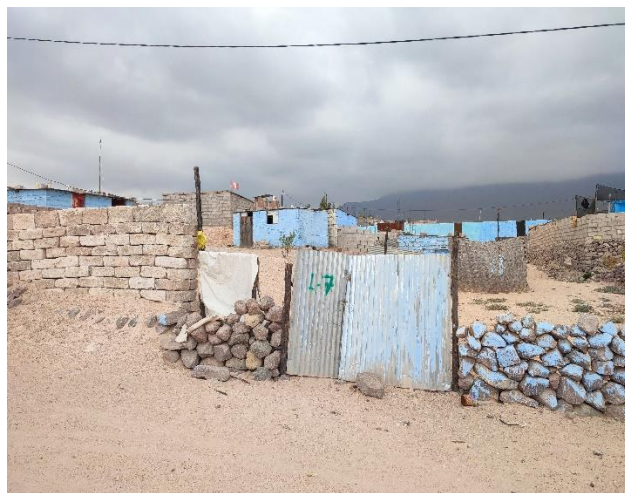
Foto tomada a la vivienda de la Mz. L Lt. 7, beneficiaria del proyecto