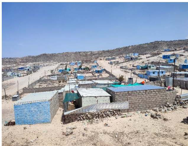
Foto panorámica de la Asociación de vivienda Utupara Avanza

Actualmente la Asociación de Utupara ha elegido un nuevo representante, por primera vez desde su conformación; el cual es el encargado de gestionar recursos ante las autoridades competentes para el beneficio y desarrollo de su Asociación; afortunadamente el nuevo dirigente es una persona proactiva y con la cual nos contactamos antes de iniciar la implementación del proyecto en la Zona C.