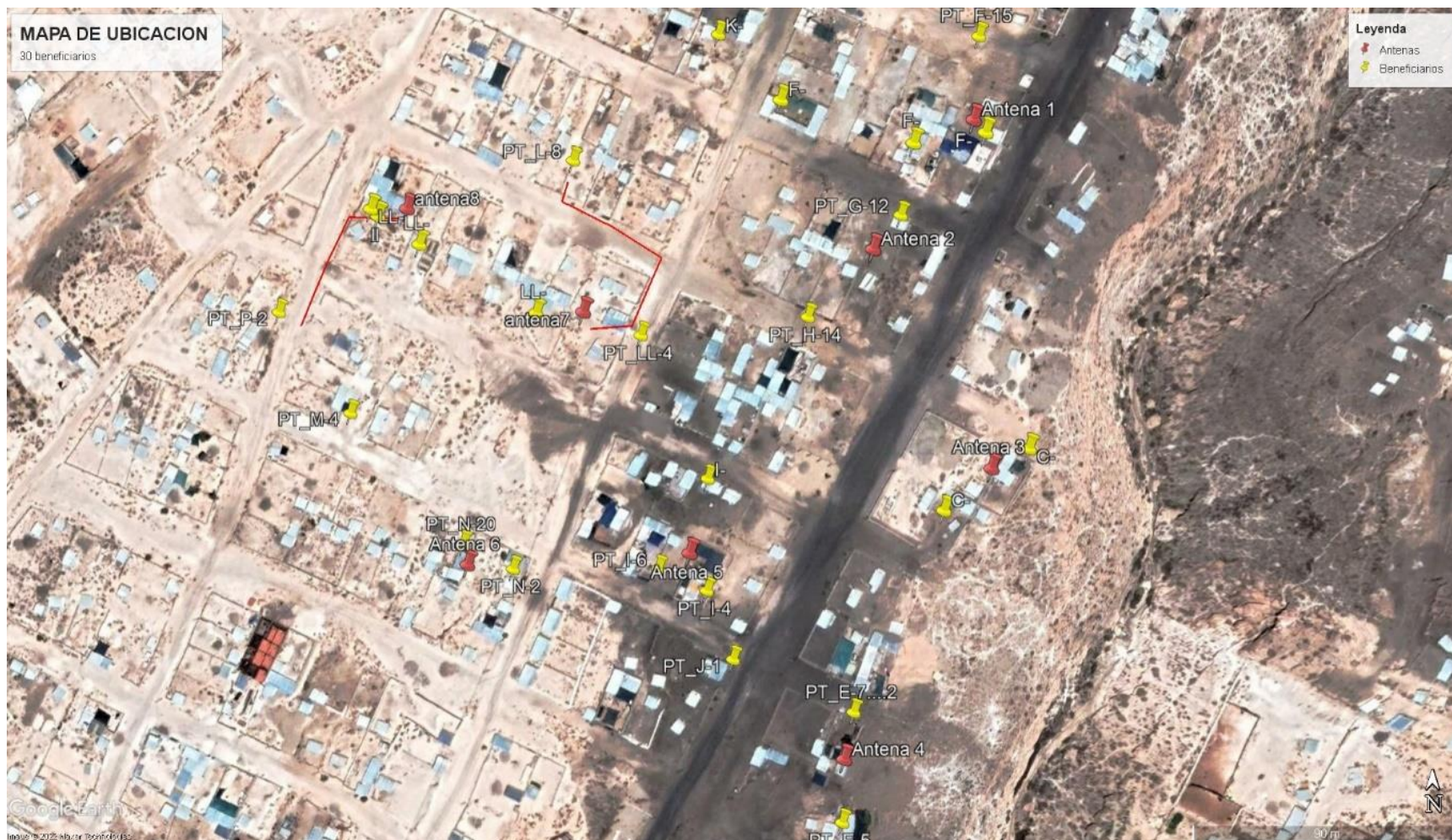
Mapa 2. Mapa de planificación e instalación de equipos para el servicio de internet en Utopara