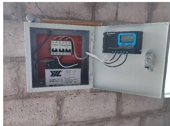
Empotrado del tablero eléctrico