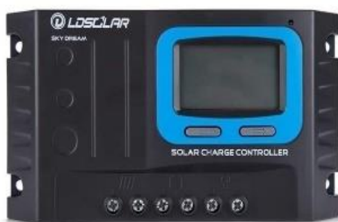
Controlador de carga de 10Amp