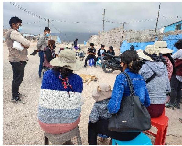
Reuniones de coordinación para la priorización de viviendas piloto