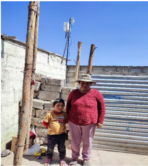
Beneficiarios del proyecto con su antena instalada Mz. D Lt. 14