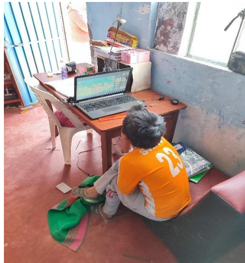
Niño participante en sus clases virtuales conectado al Wifi del proyecto Mz. G Lt. 7