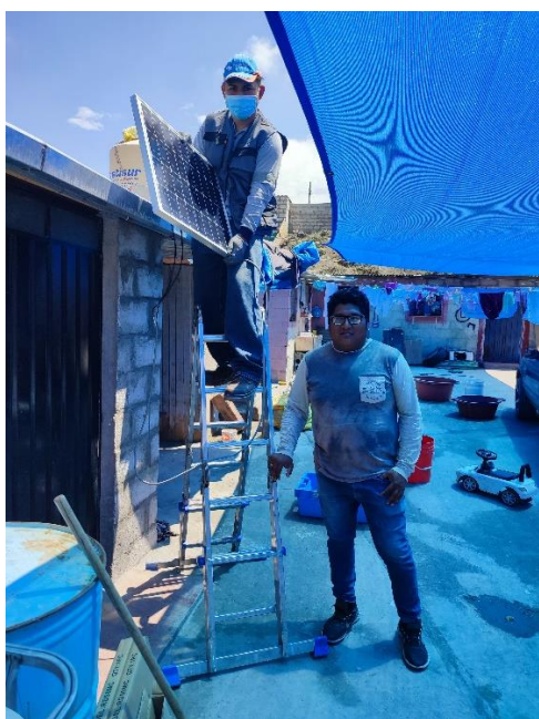
Instalación de kit de energía solar en Mz. H – Lt. 11